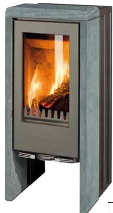
T-Line Serpentino Korpus grau