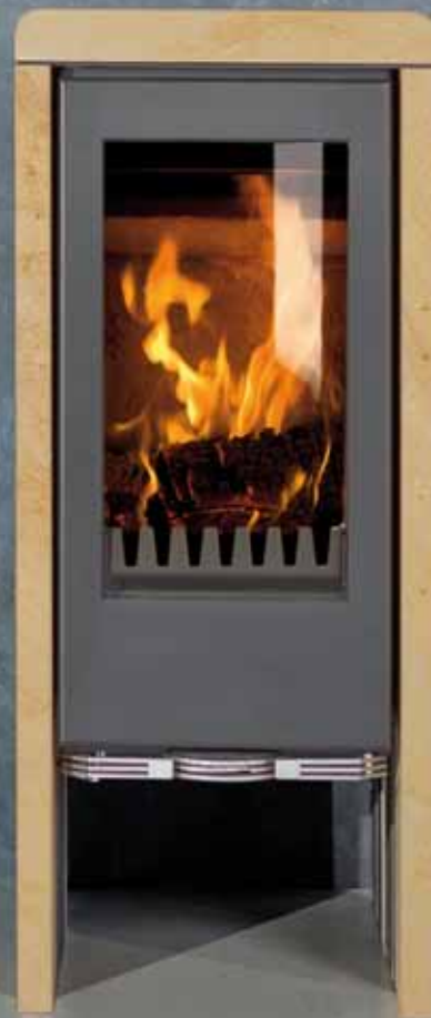
T-Line Sandstein Korpus schwarz

Goldgelber Sandstein unterstreicht auch optisch die vom Ofen ausgehende wohltuende Wärme.