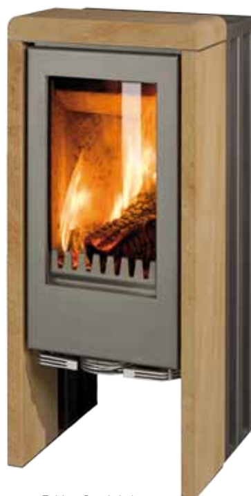
T-Line Sandstein Korpus grau