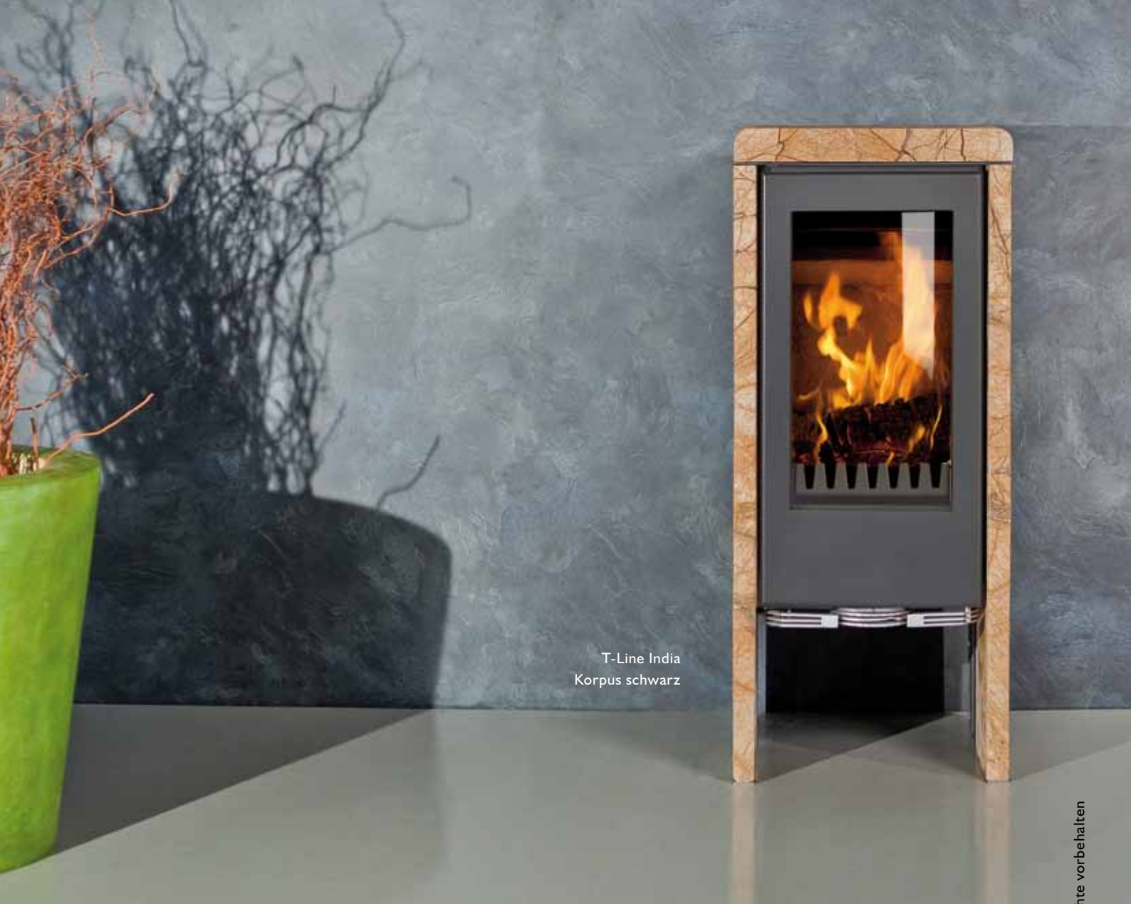
T-Line India Korpus schwarz

Royal Flame ist eine Marke der GKT Heiz- & Klimatechnik GmbH-03/2010 alle Rechte vorbehalten