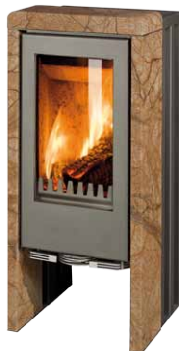
T-Line India Korpus grau